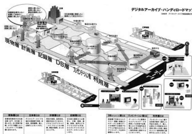
デジタルアーカイブ・ハンディロードマップ (デジタルアーカイブ白書 2003 H15.3.31 DA 推進協議会)

2000年頃の岐阜女子大学は、デジタルアーカイブ推進協議会が示したロードマップを参考に、計画、収集、保管、活用の手順でのカリキュラムを構成していた。