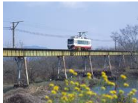
揖斐線 黒野行 伊自良川尻毛橋付近

本学では、当時、消え去っていく電車の様子は写真等で残すだけでは、電車が運行されていたとき、乗車した人の状況はどんな状態にあったのか、駅間の乗車時間や停車時間、車窓からの風景の移り変わりなど時間的なプロセスをとまなう情報は失われてしまうと考える。名鉄岐阜市内線、揖斐線、美濃町線（田神線を含む）について、ビデオカメラで出発駅から到着駅までの電車の進行方向の車窓をすべて撮影した。撮影された映像は、走行中の車内から前方の車窓の様子を出発駅から到着駅までの走行中様子が記録されており、走行中の時間的なプロセスを忠実に再現することができる。