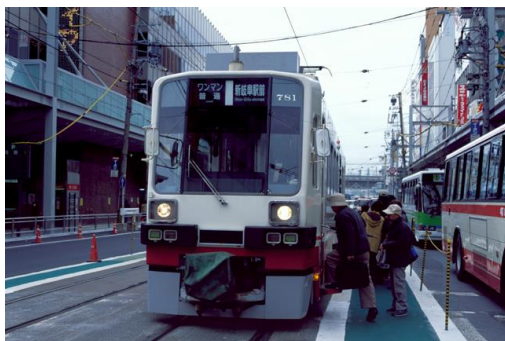
岐阜市内線 新岐阜駅前 乗降の様子

岐阜市内線は、岐阜駅前駅から忠節駅まで、および徹明町駅から長良北町駅までを結んでいた名古屋鉄道の軌道線であり、岐阜県岐阜市内を走行していたが、2005年4月1日に全線が廃止された。廃線にともなうデジタルアーカイブは、現在では撮影することのできない映像である。