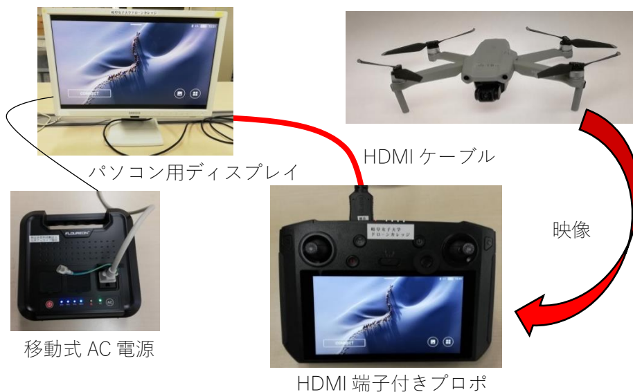
図-3 ドローンカメラ映像を多人数で観られるシステム構成図

現在このシステムを当ドローンカレッジの資格取得講習会で使っている。ドローンを教育に活用し始めて以来、この機能の出現を待ちわびていたがようやく念願が叶った思いである。