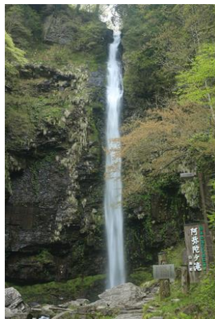
夫婦滝 白山信仰の霊場