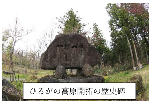
ひるがの高原開拓の歴史碑