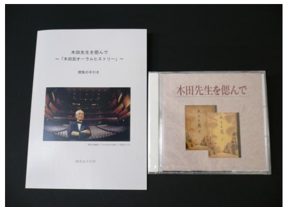
偲ぶ会で提供した木田宏オーラルヒストリー

その後、木田宏先生の教育資料の収集・整理、さらにオーラルヒストリーの作成へと発展した。木田宏先生のオーラルヒストリーは、平成7年から始め、亡くなる前年に木田宏オーラルヒストリーデジタルアーカイブとして完成した。（尚、木田先生を偲ぶ会では、DVDで提供した。）