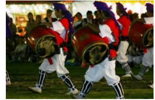
宜野湾市青年エイサー祭り