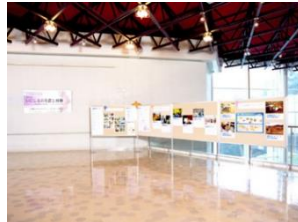
博物館展示の デジタルアーカイブ