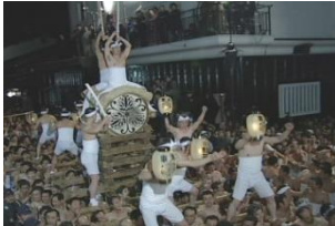
古川祭 (岐阜県飛騨市古川町)