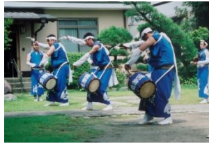
じゃんがら念仏踊り