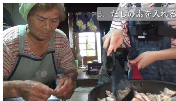
図1. 祖母に油みその作り方を教わる様子(動画)